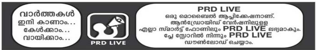
ഇൻഫർമേഷൻ & പബ്ലിക് റിലേഷൻസ് വകുപ്പ്