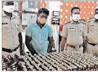
పట్టుబడిన మద్యం బాటిళ్లు

యానాం: కేంద్రపాలిత ప్రాంతం యానాం నుంచి మద్యం ఆటోలో అక్రమరవాణా అవుతున్న సమాచారం మేరకు సోమవారం యానాం పోలీసులు వాహనాన్ని పట్టుకుని మద్యం స్వాధీనం చేసుకుని కేసు నమోదు చేశారు. యానాం నుంచి ఆంధ్రా ప్రాంతానికి ఆటోలో అక్రమ రవాణా అవుతున్న రూ.40వేల విలువ చేసే మద్యాన్ని సోమవారం బైపాస్ సెంటర్లో యానాం పోలీసులు పట్టుకున్నారు. ఈ సందర్భంగా 47 రాయల్ స్టాగ్ బాటిల్స్, 295 రాయల్ గ్రీన్ క్వార్టర్ బాటిల్స్, 60 బడ్డయిజర్ బీర్లను పట్టుకుని ఆటోను సీజ్ చేసినట్లు ఎస్సై రాము తెలిపారు. బాణసంచా సీజ్ చేసిన షాపులో తనిఖీలు నిబంధనలకు విరుద్ధంగా యానాం పట్టణం నడిబొడ్డున ఉన్న జ్యోతిశ్రీ రెడీమేడ్ వస్త్రాల షాపులో నిల్వ ఉంచిన దీపావళి మందుగుండు