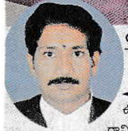
యానాంలో యోగా సాధన (అంతరచిత్రం) ఆదినారాయణమూర్తి