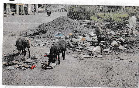
చెత్తతో పేరుకుపోయిన అంబేద్కర్ నగర్ ముఖ ద్వారం

యానాం, జూన్ 20: యానాం అంబేద్కర్ నగర్, కొత్తబస్తాండ్, పాత బస్తాండ్ కు వెళ్లే ప్రధాన రహదారి చెత్తతో డంపింగ్ యార్డును తలపిస్తుందని ప్రజలు ఆరోపిస్తున్నారు. ఈరోడ్డులో వందలాది మంది వాహనదారులు రాకపోకలు సాగిస్తున్నారు. కొత్త బస్తాండ్ నుంచి పాతబస్తాండ్ రహదారి నిర్మాణ సమయంలో కొంత కంకరను రోడ్డుపైనే ఉంచేశారు. దానికి తోడు అటుగా వెళ్తున్న పలువురు ఆక్కుడే చెత్త వేయడంతో ఆ ప్రాంత డంపింగ్ యార్డును తలపిస్తుంది. అధికారులు స్పందించి రోడ్డుపై ఉన్న కంకరను, చెత్తను తొలగించాలని ప్రజలు కోరుతున్నారు.