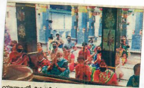
యానాంలో శివునికి పూజలు చేస్తున్న భక్తులు