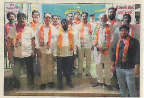
సంబరాలల్లో పాల్గొన్న బీజేపీ నాయకులు