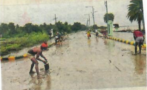
రాజీవ్ గాంధీ బీచ్ రోడ్డులో శుభ్రం చేస్తున్న సిబ్బంది

యానాం, ఆగస్టు 28: వరద తాకిడికి రాజీవ్ గాంధీ బీచ్ లోని పర్యాటక బోట్ హౌస్ పూర్తిగా నీటమునిగింది. ఈ బోట్ హౌస్ ద్వారా పలువురు పర్యాటకులను గౌతమీ గోదావరిలో విహరింప చేసేందుకు ప్రత్యేక బోట్లు ఉన్నాయి. ఆయితే వరదతో బోట్లను టైడల్ లాక్ నమీపంలోని నిలిపారు. వరద తగ్గడంతో రాజీవ్ గాంధీ బీచ్, పెర్రీ రోడ్డులోని విగ్రహాలను అగ్నిమాపక, ముస్సిఫల్ సిబ్బంది శుభ్రం చేస్తున్నారు. రెండు రోజుల్లో పూర్తిస్థాయిలో పర్యాటకులకు రాజీవ్ గాంధీ బీచ్ ను ఆందుబాటులో తెచ్చేందుకు నిర్వాహకులు, యంత్రాంగం చర్యలు చేపడుతుంది.