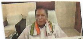
సీఎంలతో వీడియో కాన్ఫరెన్స్ ద్వారా మాట్లాడుతున్న సోనియా గాంధీ

యానాం: యానాంలో 13 పాజిటివ్ కేసులు నమోదయ్యాయని, ఇద్దరు కరోనాతో మరణించినట్లు పరిపాలనాధికారి శివరాజ్ మీనా తెలిపారు.