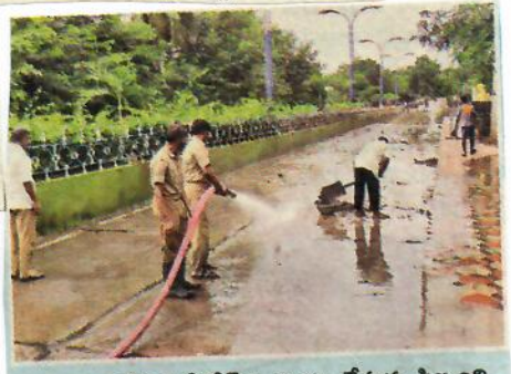
యానాంలోని ఫెర్రోడెను శుభ్రం చేస్తున్న సిబ్బంది

పులో వరదనీరు ఇళ్ల చుట్టూ చేరడంతో ఎటూ కదలలేని పరిస్థితిలో చిక్కుకున్న వరద బాధితులకు యానాం వృద్ధాశ్రమ బుధవారం ఆల్పాహారం, భోజన వసతి కల్పించారు.