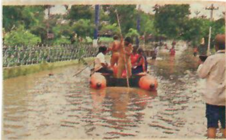
యానాంలోని ఫెర్రీ రోడ్డులో అగ్నిమాపకశాఖ ఫైబరు బోటులో ప్రజలను సురక్షిత ప్రాంతాలకు తరలిస్తున్న సిబ్బంది