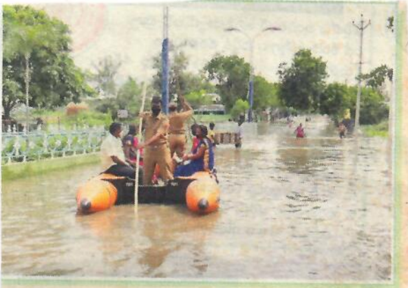
యానాంలో ఫైబర్ బోటులో ప్రజలను తరలిస్తున్న అగ్నిమాపకశాఖ సిబ్బంది