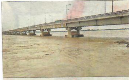
యానాం-ఎదుర్గంక బాలయోగి వారి వద్ద వరద ప్రవాహం

యానాం వద్ద.. యానాం: భారీ వర్షాలకు తోడు గోదావరి వరద ప్రవాహం పెరుగుతుండటంతో శుక్రవారం నుంచి యానాం వద్ద గోతమీ గోదావరి ఉరకలెత్తుతూ, వరవళ్లు తొక్కుతూ ప్రవహిస్తోంది. వరదనీరు భారీగా వస్తుండటంతో రాజీవ్ రివర్ బీచ్ లోని ప్రభుత్వ టూరిజం శాఖకు చెందిన బోట్ హౌస్ వద్దకు నీరు చేరింది. వరద ప్రవాహం పెరుగుతుండటంతో ట్రిడల్ లాకు గేట్లు సైతం ముందస్తుగా మూసివేశారు.