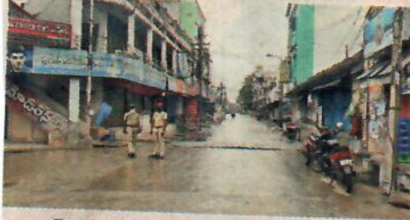
లాక్ డౌన్ తో జనసంచారం లేని ప్రధాన వీధులు

యానాం: కరోనా వ్యాప్తి నియంత్రణకు పుదుచ్చేరి ప్రభుత్వం యానాంలో అమలు చేస్తున్న మూడు రోజులు లాక్ డౌన్ సోమవారం ప్రశాంతంగా కొనసాగింది. అన్ని కార్యాలయాలు, వ్యాపారసంస్థలు మూతపడ్డాయి. పోలీసులు ప్రధాన చెక్ పోస్టులలో ప్రత్యేక బందోబస్తు ఏర్పాటుచేసి రాకపోకలు జరగకుండా నిరోధించారు. పూర్తి లాక్ డౌన్ అమలుచేస్తున్నందున ప్రత్యామ్నాయ ఏర్పాట్లు చేసుకోవాలని ముందుగానే తెలియజేసినా విధులకు వెళ్లాలంటూ చెక్ పోస్టుల వద్ద పలువురు పోలీసులతో వాగ్వాదానికి దిగడం కనిపించింది. కరోనా నిబంధనలు అమలు చేశాక యానాంలో ఇంత వరకు 9,708 మందిపై జరిమానాలు విధించినట్లు ఎస్పీ ఆర్. భక్తవత్సలన్ తెలిపారు.