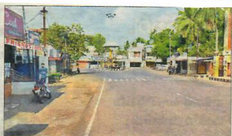
నిర్మానుష్యంగా యానాం పాతబస్టాండ్ సెంటర్