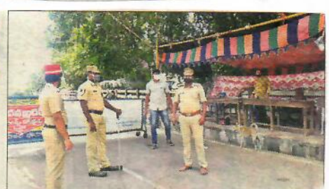
యానాం- నీలపల్లి సరిహద్దు చెక్పోస్టు వద్ద పోలీసు బందోబస్తు