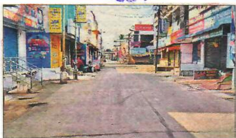
జనసంచారం లేని యానాంలోని చిన్నాసెంటర్