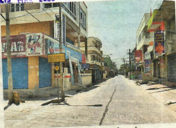
నిర్మాణవ్యంగా ఉన్న యానాంలోని ఓ వీధి