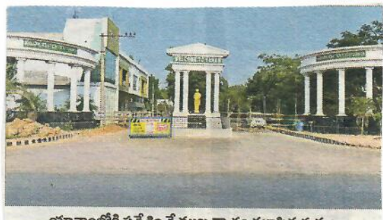
యానాంలోకి ప్రవేశించే ముఖ ద్వారం మూసిన దృశ్యం