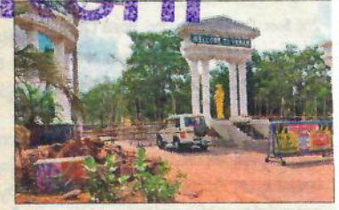
కర్లతో కట్టి మూసివేసిన యానా- ఏపీ సరిహద్దులు

యానా: యానాలో జనతాకర్మాను ఆదివారం ప్రజలు స్వచ్ఛందంగా పాటించారు. ఉదయం 5 గంటల నుంచే నియోజకవర్గ ప్రజలు ఇంటికే పరిమితమై స్వీయనిర్బంధం విధించు కున్నారు. అదేవిధంగా వివిధ వ్యాపార సముదాయాలు మూతపడ్డాయి. అత్యవసరమైన మెడికల్ షాపులు మాత్రమే తెరిచారు. పెట్రోల్ బంకులు, హోటళ్లు, నిత్యావసర వస్తువుల దుకాణాలు తదితరమైనవి మూతపడ్డాయి. ముఖ్యంగా యానా పట్టణంలో ప్రజలెవరూ రోడ్డుమీదకు రాకపోవడంతో రహదారులన్నీ నిర్మాణవ్యయంగా మారి వెలవెలబోయాయి. యానా, అమలాపురం, విశాఖపట్టణం, రామచంద్రపురం తదితర ప్రాంతాలకు వెళ్లే జనంతో నిత్యం కిటకిటలాడే న్యూబస్టాండ్, పాతబస్టాండ్ ఏరియాలు వెలవెలబోయాయి. యానాలో ఆంధ్రప్రదేశ్ కంటే తక్కువ ధరలో పెట్రోల్, డీజిల్ లభిస్తుండటంతో చాలామంది వాహనచోదకులు యానా వస్తుంటారు. కాని పెట్రోల్ బంకులు మూసివేతతో ఎవరూ రాని పరిస్థితి కనిపించింది. మిగిలిన పర్యాటకేంద్రమైన రాజీవీంద్రబీచ్ సుతం వెలవెలబోయింది. సరిహద్దుల మూసివేత