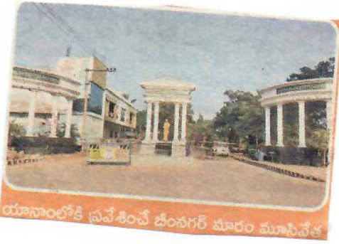
యానాంలోకి ప్రవేశించే బీసీగర్ మారం మూసివేత