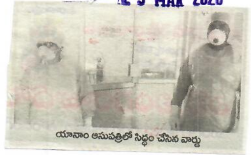
యానాం ఆసుపత్రిలో సిద్ధం చేసిన వార్డు