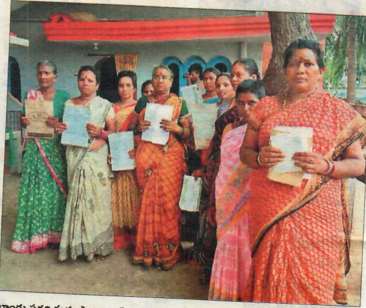
బాండ్లు ప్రదర్శిస్తున్న సావిత్రినగర్ అక్షయగోల్డ్ బాధితులు