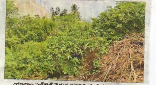
యానాం సబ్ జైల్ వెనుక అడవిని తలపిస్తున్న మొక్కలు

యానాం, జూలై 14: యానాం సబ్-జైల్ వెనుక పిచ్చిమొక్కలు ఏపూగా పెరిగి చిట్టడవిని తలపిస్తున్నాయి. ఈవైపునే రిజెన్సి కాలనీకి మార్గం ఉంది. రోడ్డుకు రెండు వైపులా మొక్కలు పెరిగిపోవడంతో ఇటీవల ప్రజా పన్నులశాఖ వారు వాటిని తొలగించారు. అయితే వెనుక వైపు ఉన్న మొక్కల ప్రాంతం, కింద ఉన్న డ్రైన్ ముస్లిలిపాలిటేడి కావడంతో వాటిని ఆ అధికారులు పట్టించుకోకుండా వదిలివేశారు. ఇటీవలే ఇద్దరు రిమాండ్ ఖైదీలు సబ్-జైల్ గోడదూకి పారిపోయారు. ఈ తుప్పులు తొలగించకపోతే ఈ విధమైన పరిస్థితులు మరిన్ని తలెత్తుతాయి. ఇప్పటికైనా అధికారులు స్పందించి పిచ్చి మొక్కలను తొలగించాలని పలువురు కోరుతున్నారు.