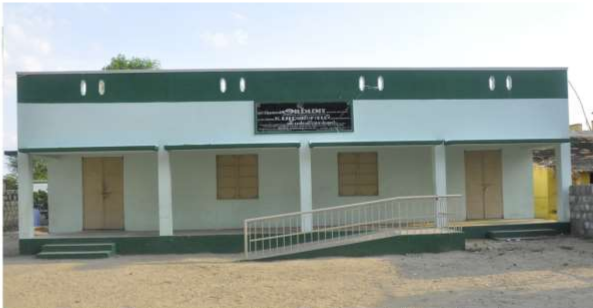
Name Of Work : Construction of Two Class Rooms Building in Panchayat Union Middle School at Rangampalayam, Konganapuram Block of Salem District. Estimate Amount. Rs. 16.00 Lakhs