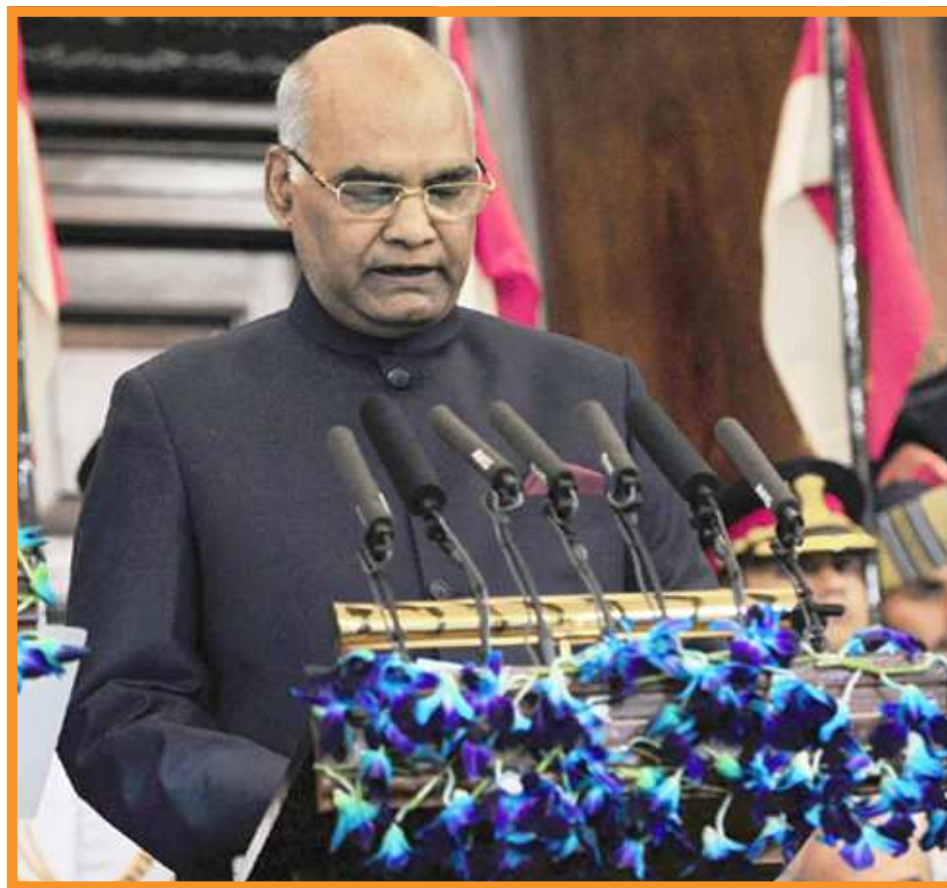
Shri Ram Nath Kovind addressing after taking oath of office of the President of India at a swearing-in ceremony in the central hall of Parliament in New Delhi on July 25, 2017. ( File Pohto)

Hon'ble President will Stay at Bangaram, the International Tourist Island of India for three days before leaving to New Delhi.