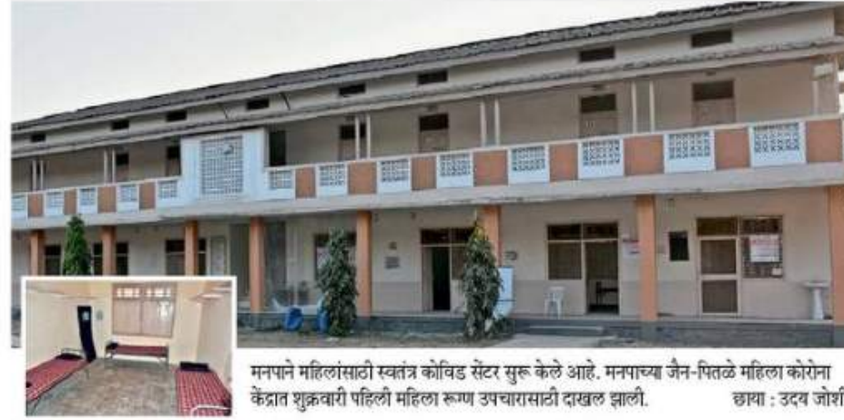
मनपाने महिलांसाठी स्वतंत्र कोविड सेंटर सुरू केले आहे. मनपाच्या जैन-पितळे महिला कोरोना केंद्रात शुक्रवारी पहिली महिला रुग्ण उपचारासाठी दाखल झाली.

शहरात ६३६ अँक्टिव्ह रुग्ण, होम क्वारंटाईनची संख्या समजेना, महिलांसाठी स्वतंत्र केंद्र